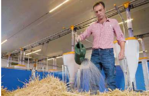
Das revolutionäre Strohstallkonzept